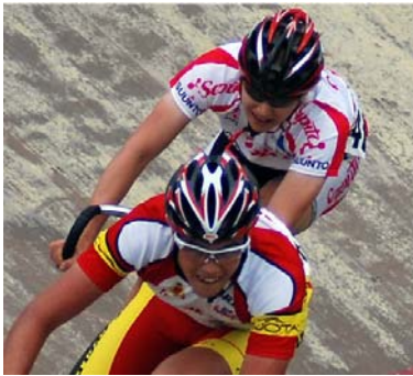
Centre national de cyclisme