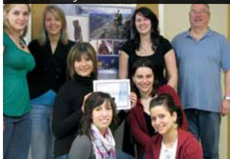
Le Hamac : un lieu de répit pour les parents d'enfants souffrant d'un TED